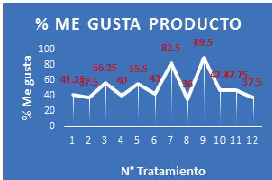
Figura 1: Análisis de prototipos para QDA.

Los tratamientos con mayor aceptación fueron el tratamiento siete con 82,5% de aceptación y nueve con 89,5% por lo que fueron los escogidos para realizar el Análisis QDA (Quantitative Descriptive Analise) (figura #1) para valorar el perfil Ideal. A continuación, se muestran los resultados de los diferentes tratamientos en el test de preferencia: